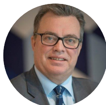
Urban Doverholt Ordförande