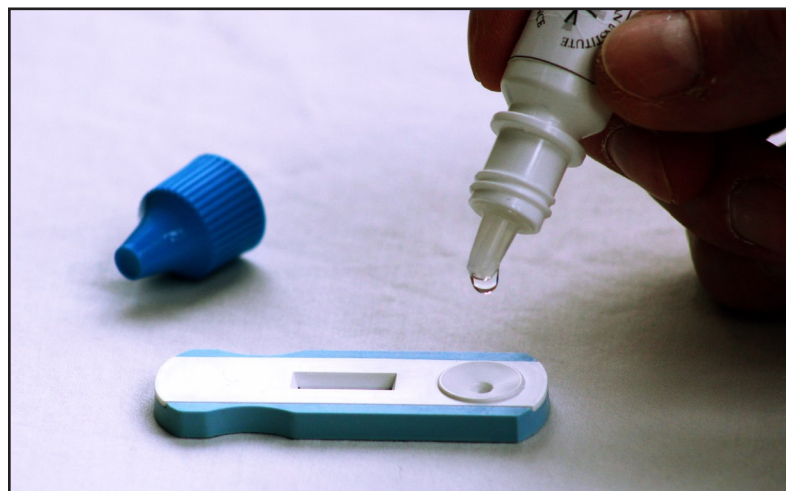
European Institute of Science AB har tillsammans med vår amerikanska joint venture-partner utvecklat ett snabbtest för veterinärmarknaden. På bilden syns lateral flow snabbtestet för inflammationsmarkören CRP i hund.

Bolaget har även slutit ett joint venture-avtal med bolaget Dia-System Scandinavia AB ( www.diasystem.se ) som är verksamt inom produktion och försäljning inom klinisk kemi, hematologi, immunologi samt blodcellsavbildning, med produkter såsom bland annat automatiska analysatorer, reagens, kontroller, IT samt instrumentservice. Joint venture-avtalet omfattar en gemensam produktion samt kommersialisering av reagens, standarder samt kontroller, för detektion av inflammationsmarkörerna CRP hos hund samt SAA hos häst, och som enbart är avsedda för veterinära applikationer på automatiska analysatorer. Produkterna kommer att säljas globalt under EURIS varumärke. Testet för CRP har redan utvecklats internt på EURIS och förväntas att efter en kliniskt evaluering släppas under år 2016 på veterinärmarkanden.