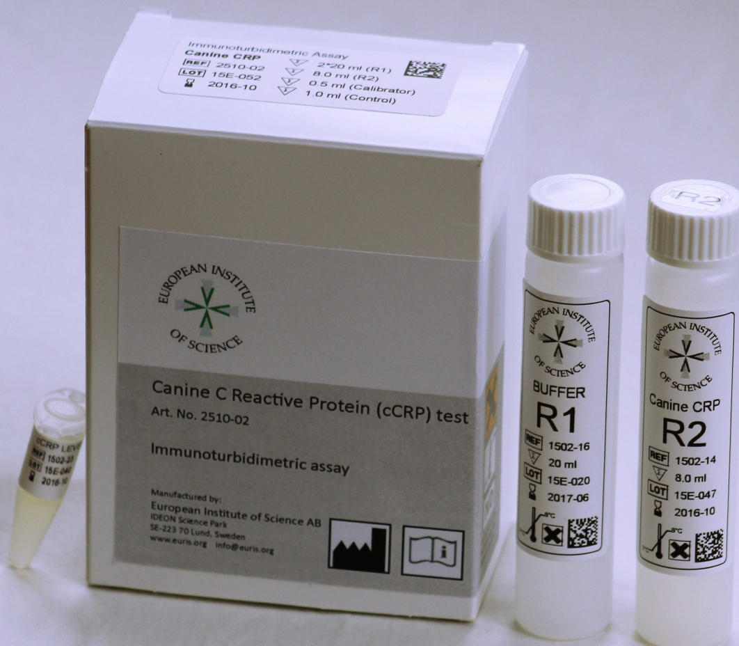
European Institute of Science AB har tillsammans med DiaSystem Scandinavia AB utvecklat veterinära reagens för automatiska analysatorer. På bilden syns reagens för inflammationsmarkören hund-CRP.