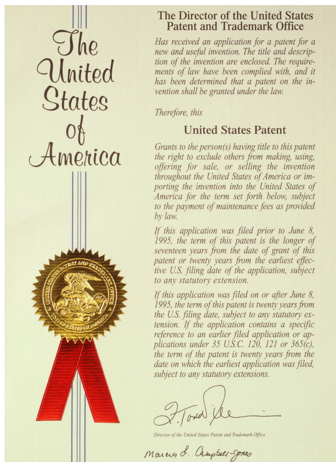
Flera av forskningsprojekten som har bedrivits inom European Institute of Science AB har resulterat i godkända patent t ex i USA.