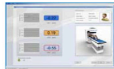
3. RayPilot® Mjukvara