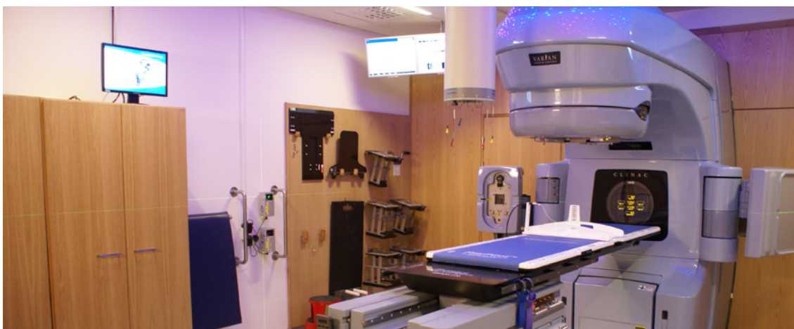
RayPilot® Installerat på Karolinska Universitetssjukhuset

Styrelsens beslut om att genomföra nyemissionen görs med stöd av det beslut om nyemission som togs på årsstämman den 19 maj 2011.