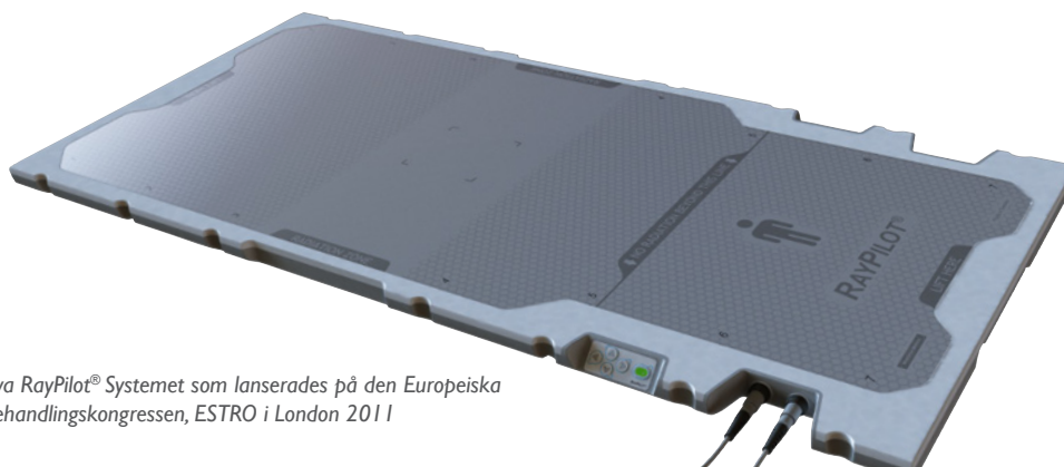
Det nya RayPilot® Systemet som lanserades på den Europeiska strålbehandlingkongressen, ESTRO i London 2011

Snarast möjligt efter att teckningstiden avslutats och senast i början av juli 2011, kommer Bolaget att offentliggöra utfallet av emissionen. Offentliggörande kommer att ske genom pressmeddelande och finnas tillgängligt på Bolaget hemsida.