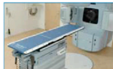
1. RayPilot® Mottagarsystem