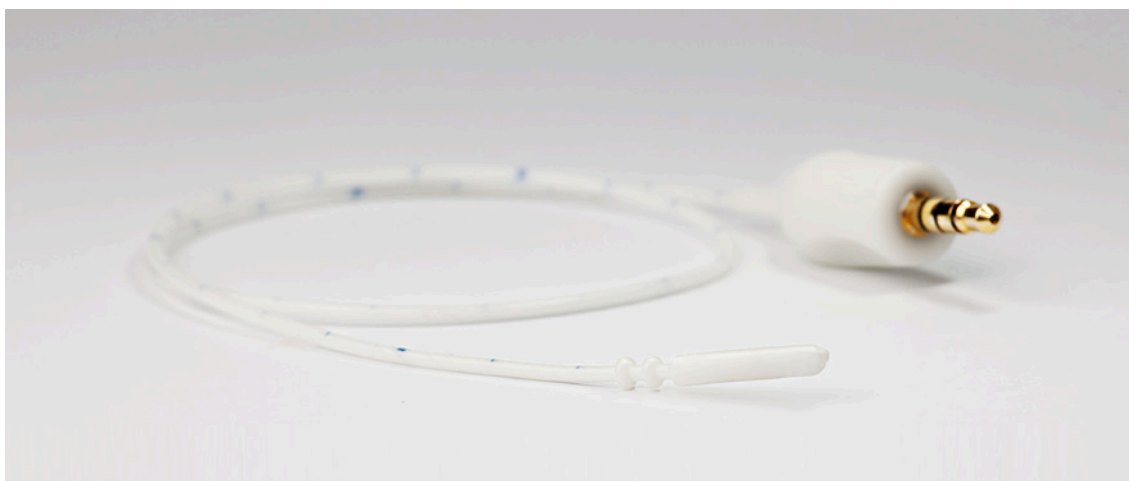
RayPilot® Sändare, som är en förbrukningsvara