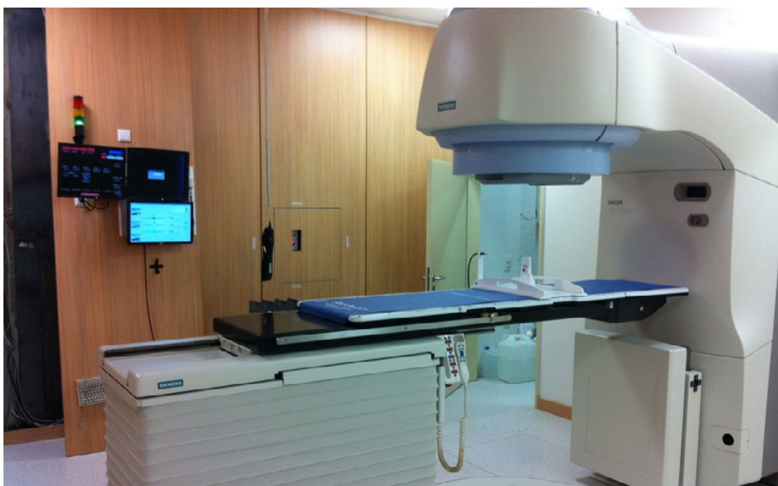
RayPilot® Installerat på Universitetssjukhuset i Rostock

Anmälan om teckning utan stöd av teckningsrätter skall göras under samma tidsperiod som teckning med företrädesrätt. Anmälan om teckning skall göras på särskild anmälningsedel 2 som finns tillgänglig på Bolagets hemsida eller kan erhållas från Aktieinvest FK AB. Anmälningsdelen skall vara Aktieinvest tillhanda senast den 27 juni 2011. Observera att anmälan är bindande.