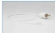
2. RayPilot® Sändare