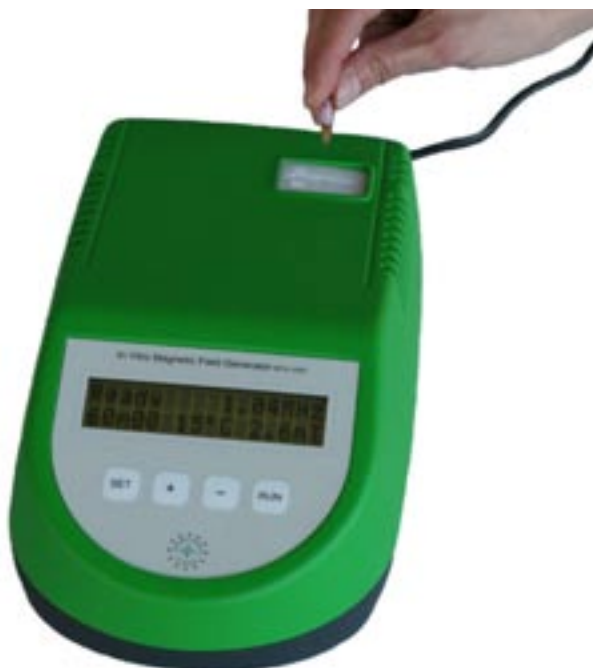
På bilden syns EURIS nya produkt In Vitro Magnetic Field Generator MFG-1000 (magnetfältsgenerator för medicinsk forskning).

Målgruppen för In Vitro Magnetic Field Generator MFG-1000, är forskare och läkare som arbetar med magnetfältsinducerad uppvärmning av magnetiska nanopartiklar. Den ekonomiska potentialen för In Vitro Magnetic Field Generator MFG-1000 är svår att uppskatta. En försäljning på 50-100 enheter på kort sikt bedöms rimlig att uppnå. Med en prisbild på 50 tSEK per enhet skulle det motsvara en försäljning på 2,5 - 5,0 MSEK. Varje sålt instrument förväntas generera återkommande försäljning av magnetiska nanopartiklar som kommer att produceras av EURIS.