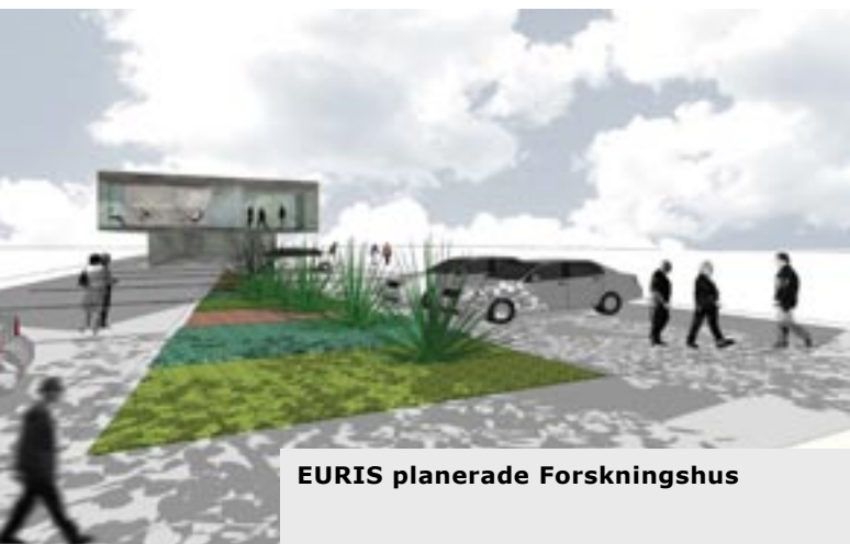
EURIS planerade Forskningshus

Under 2007 förvärvade EURIS en fastighet för 1,38 MSEK på det attraktiva Brunnshögsområdet nära IDEON Science Park i Lund. Fastigheten (f d bensinstation) sanerades under april 2008, vilket motsvarade en ytterligare investering på 0,65 MSEK. EURIS har tillsammans med en arkitekt tagit fram en konceptskiss för ett forskningshus på 674 m 2 med framtida expansionsmöjligheter till 2 300 m 2 . Forskningshuset kommer att kunna användas för EURIS egna verksamhet samt för attraktion av nya forsknings- och utvecklingsbolag till vår portfölj. Både portföljbolagen och externa bolag kommer att ges möjlighet att expandera sin verksamhet i det planerade forskningshuset på marknadsmässiga hyresvillkor. Konceptskissen kommer under 2009 att presenteras för Byggnadsnämnden i Lunds Kommun.