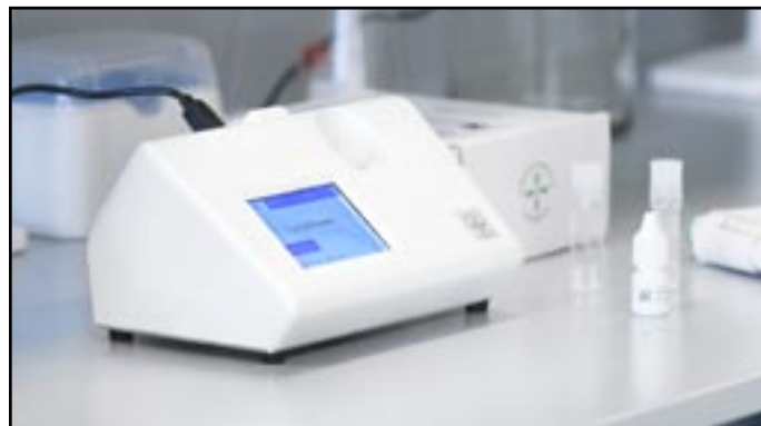
EURIS TurboReader™ veterinärt instrument för patientnära (POC) blodmätning av bl a hund-CRP.

För att bolaget ska kunna utvecklas och växa i takt med den förväntade ökningen i leveransvolymer sker produktionen både internt och hos underleverantörer. Vi ställer höga kvalitetskrav och bedömer det därmed fördelaktigt att behålla produktionen av vissa kritiska komponenter samt slutmonteringen inom bolagets väggar. Bolaget har tillgång till ett eget forskningslaboratorium i forskningsbyn IDEON (Lund) samt genom sin filial ett produktionslaboratorium i Kastrup (Danmark).