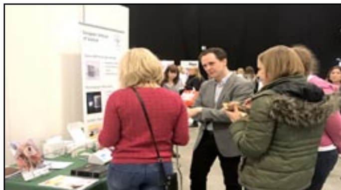
EURIS Vd demonstrerar TurboReader™ instrumentet under VeTa-dagarna i Malmö (31 mars - 2 april 2017).

Vi har valt att inom Sverige sälja direkt till slutkunder som veterinärsjukhus med egna laboratorier och mindre veterinärmottagningar via vårt försäljningskontor på Gateway IDEON i Lund. Detta för att hålla en nära kontakt med slutanvändarna så att nya produkter kontinuerligt kan tas fram anpassade efter kundens behov. Internationellt sker försäljningen genom distributörer. Idag har bolaget tecknat exklusiva distributionsavtal med återförsäljare i Litauen, Taiwan och Danmark. Vår målsättning är att med ett enklare och snabbare provförfarande som ger noggrannare resultat jämfört med våra konkurrenter snabbt öka vår marknadsandel inom patientnära test.