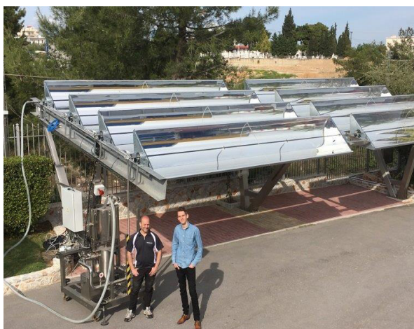
Installation av Absolicons solfångare i Saravanos, Grekland

Eftersom prestandan hos en solfångare är svår för en kund att utvärdera är solvärmehandeln uppbyggd kring tester genomförda av ackrediterade testinstitut.