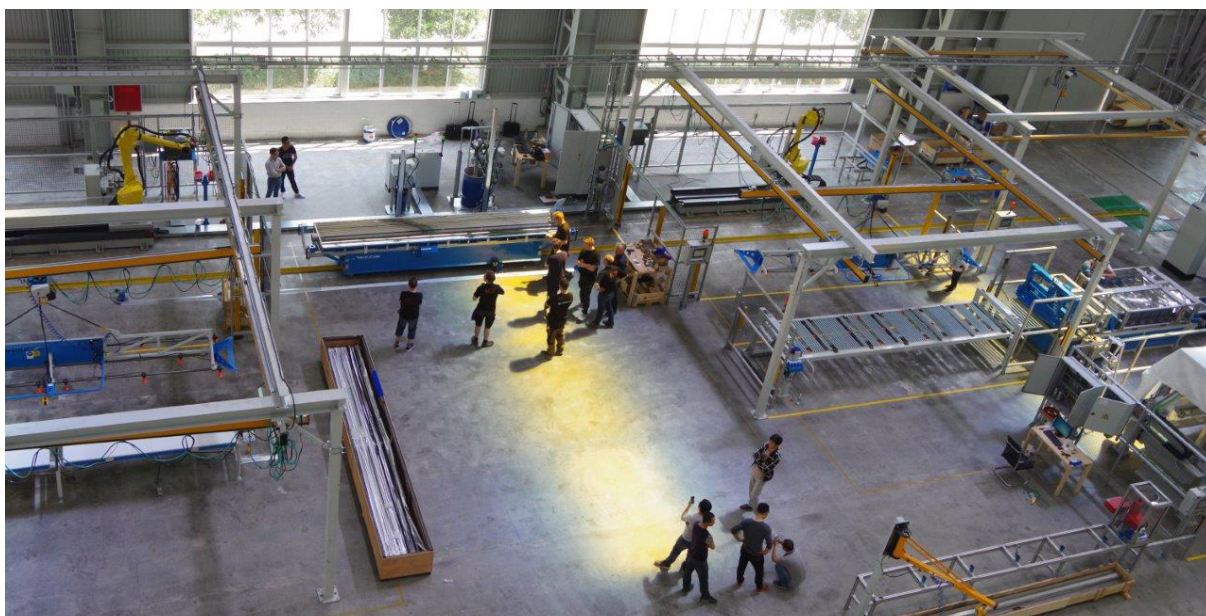
Interiörbild från den Kinesiska produktionsanläggningen.

Produktionslinan har flera patentskyddade metoder för att säkerställa att varje tillverkad solfångare alltid har samma höga optiska verkningsgrad.